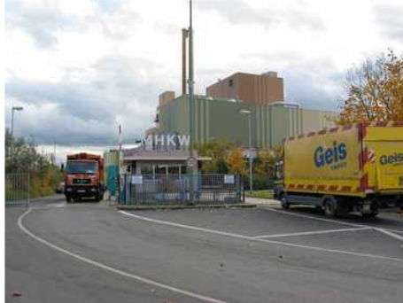
Sowohl Eingangs- als auch Ausgangsverwiegung kann der Fahrer übernehmen.